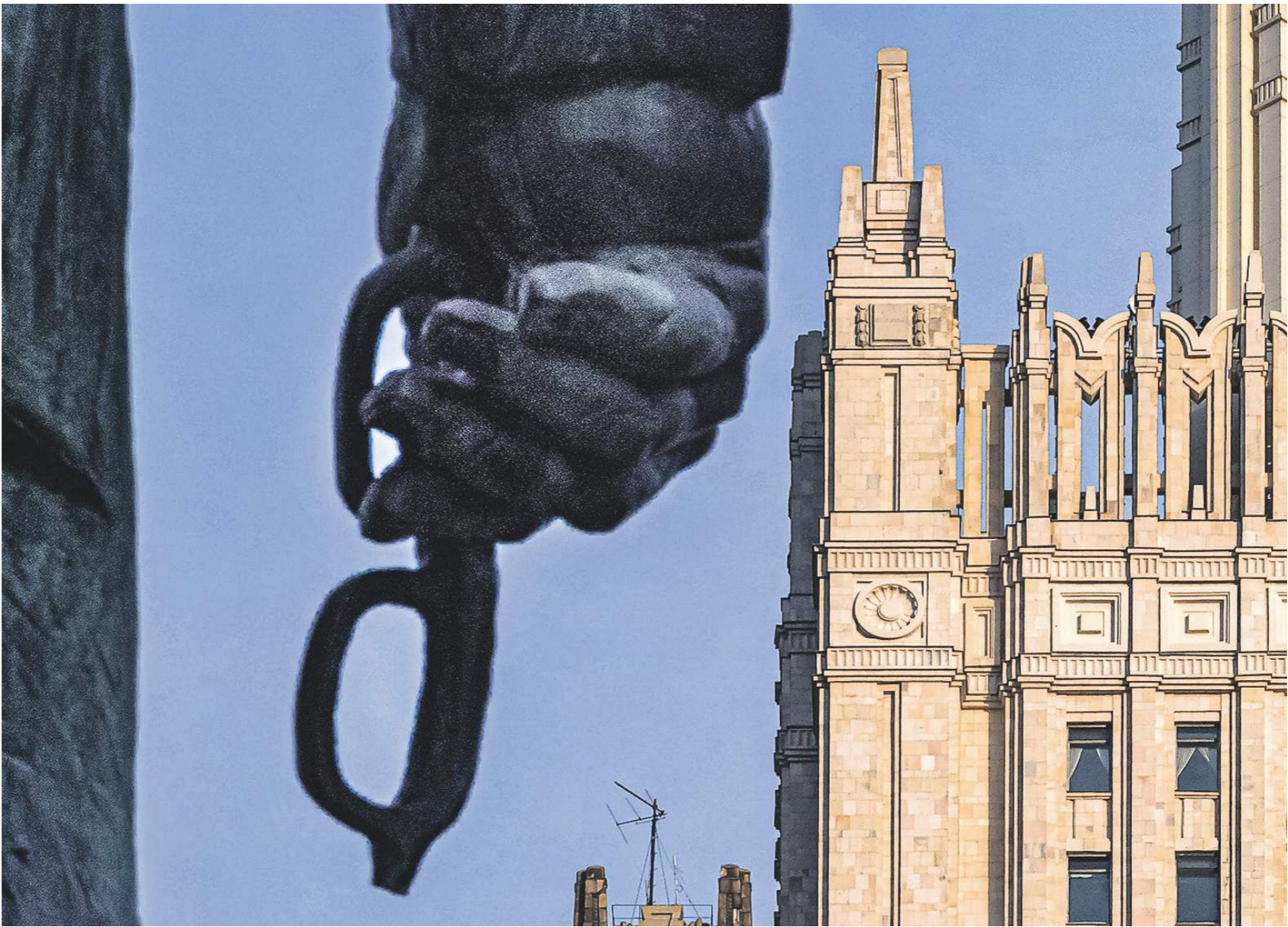
Константин Кошкин / «Известия»